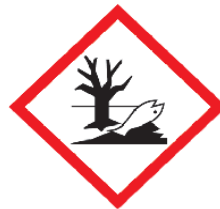
DAÑO AL MEDIO AMBIENTE

Señal de seguridad según NCH1411/4 : Azul (Salud)= 3; Rojo (Inflamabilidad)= 1; Amarillo (Reactividad)= 2.